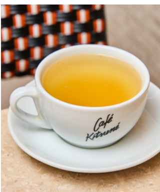
Yuzu and honey

Toutes nos boissons sont aussi disponibles avec supplément (extra shot d'espresso ou lait végétal) et en version « glacée ». Lait végétal : avoine, amande, coco ou soja/Sirop : agave, érable ou vanille. All our beverages are also available with add-ons (extra shot of espresso or non-dairy milk) and in « iced » version. Non-dairy milk: oat, almond, coco or soy/Syrup: agave, maple or vanilla.