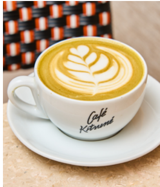
Dirty matcha latte