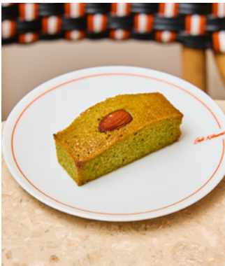
Financier matcha (sans gluten)