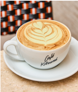
Chocolat chaud et matcha