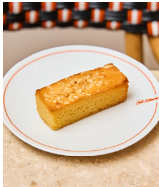
Financier noisette (sans gluten)