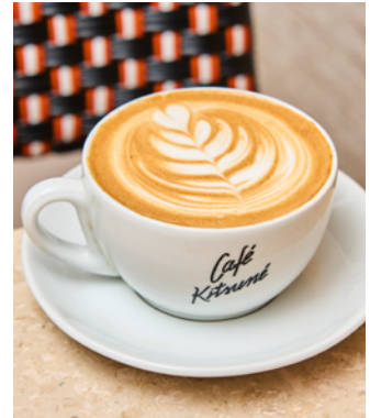
Dirty chai latte

Toutes nos boissons sont aussi disponibles avec supplément (extra shot d'espresso ou lait végétal) et en version « glacée ». Lait végétal : avoine, amande, coco ou soja/Sirop : agave, érable ou vanille. All our beverages are also available with add-ons (extra shot of espresso or non-dairy milk) and in « iced » version. Non-dairy milk: oat, almond, coco or soy/Syrup: agave, maple or vanilla.