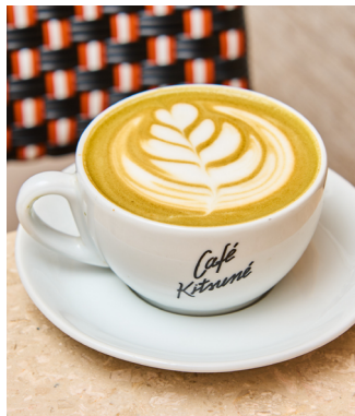
Dirty matcha latte