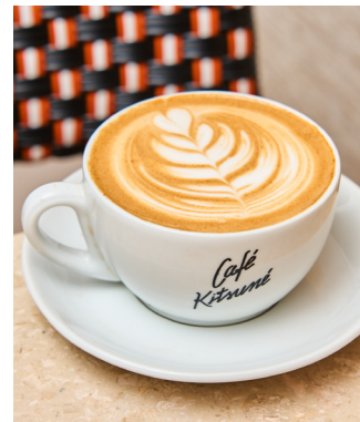
Dirty chai latte

Toutes nos boissons sont aussi disponibles avec supplément (extra shot d'espresso ou lait végétal) et en version « glacée ». Lait végétal : avoine, amande, coco ou soja/Sirop : agave, érable ou vanille. All our beverages are also available with add-ons (extra shot of espresso or non-dairy milk) and in « iced » version. Non-dairy milk: oat, almond, coco or soy/Syrup: agave, maple or vanilla.